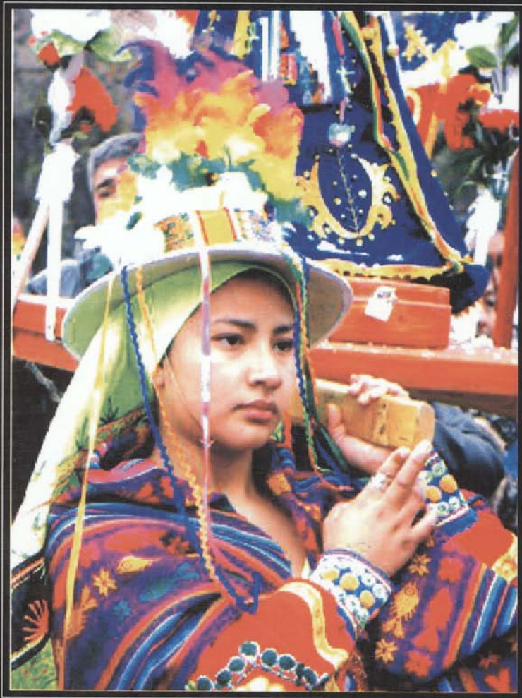
Procesión de la Virgen de Urkupiña