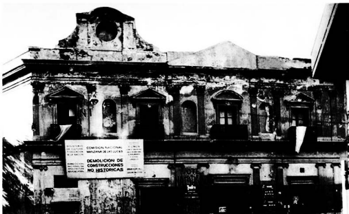
La demolición de "obras no históricas" por el CONOMOS en 1974.

No sin regocijo Sarmiento instalaría al lisiu primera Escuela Modelo, la de la parroquia de Catedral al Sur para consolidar la imagen dialéctica del triunfo de la "civilización" frente a la "barbarie". Esta Escuela formada por el aporte económico del vecindario y siguiendo las directivas expresas de Sarmiento sobre el modelo norteamericano, sin embargo fracasaría en su lustro por la imposibilidad de hacerla sustentable tal como señala el maestro francés Lagoutte que la tendría a su cargo. El edificio de los Ezcurra albergaría también el Correo en el último tercio del siglo XIX y la casa de Gobierno de la Provincia de Buenos Aires hasta su traslado a La Plata luego de 1882. El Correo sería también mudado a comienzos del siglo XX a un edificio de la familia Anchorena en la calle Reconquista y Corrientes hasta su localización en el Palacio que se erige y culmina en 1927 y que hoy se está transformando para ser cultural.