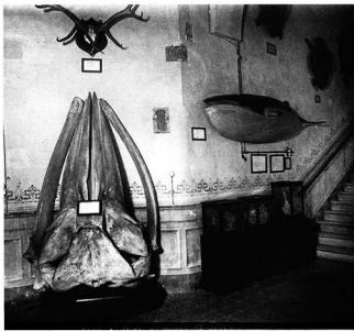
El patio de la nueva facultad de Ciencias Exactas en el siglo XX y el Museo de Ciencias Naturales en la Manzana.