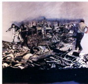
Días de furia II , 2009 Pintura acrílica y transformación fotográfica s/tela 1,60 x 1,80 m.

Los pasos del ascenso incluyen, por supuesto, las convulsiones de Días de furia , telas con transposiciones fotográficas realizadas en 2008, y las descripciones visuales de la fatiga de los pobres, cuya protesta por sus derechos se trasluce, otra vez mediante la paradoja de las evocaciones imaginarias de lo contradictorio,