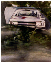
Paisajes con retrovisor, 1975 Pintura acrílica s/tela 1,10 x 1,20 m. Colección particular

Comienzo por los Paisajes que Dowek pintó de 1972 a 1976, la serie llamada De los espejos retrovisores . En el parabrisas de un automóvil que nos deja ver el campo, a veces el horizonte o el cielo, se introduce merced al espejo un espacio invertido donde descubrimos el mundo que hemos dejado atrás y, en la imagen refleja, un perseguidor o un cadáver abandonado. Perspectiva doble, entonces,