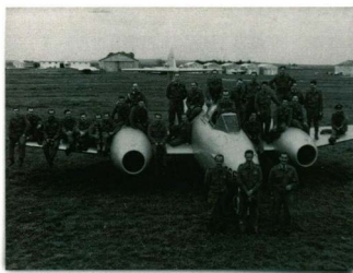
Foto tomada durante un entrenamiento en Tandil en febrero de 1950.